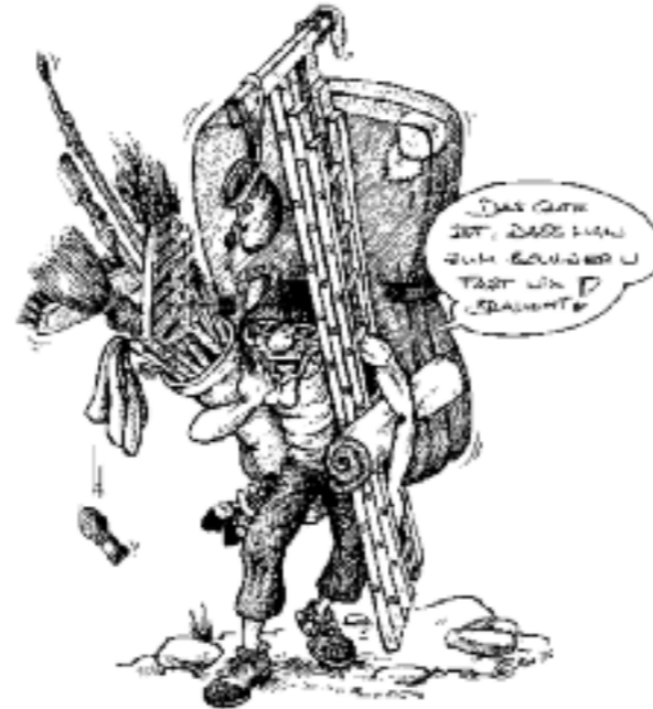
Titel-Karikatur: Sebastian Schrank „Aufstieg“ Titel-Foto: Martin Oberniedermaier Westliche Dreitorspitze 1928, Archiv der AV-Sektion Ga-Pa