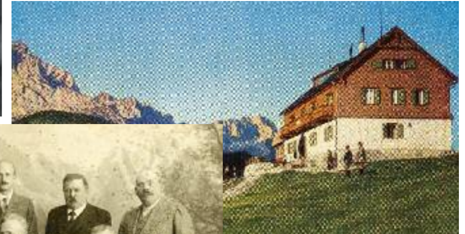
Kreuzeckhaus, Farbpostkarte um 1910