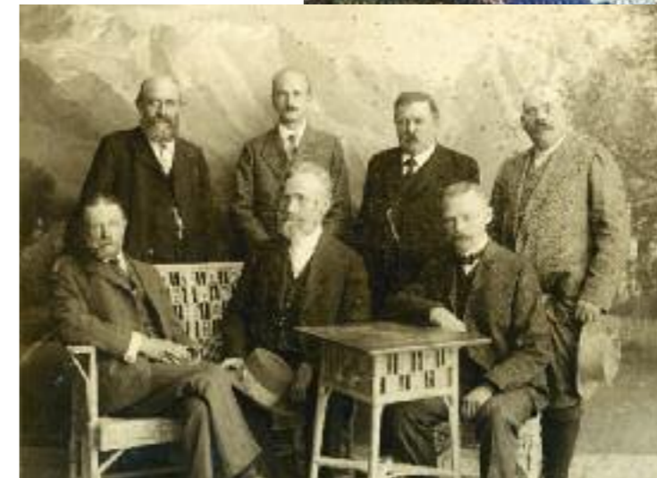
Vorstandsbild um 1905