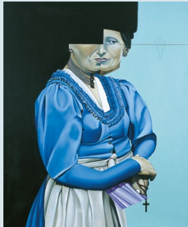
Elisabeth Endres, Es ist ganz anders (Ausschnitt), Acryl auf Leinwand, 1995

Im Medienraum können Sie einen Film über das Passionsspiel oder historische Filme über Oberammergau sehen.